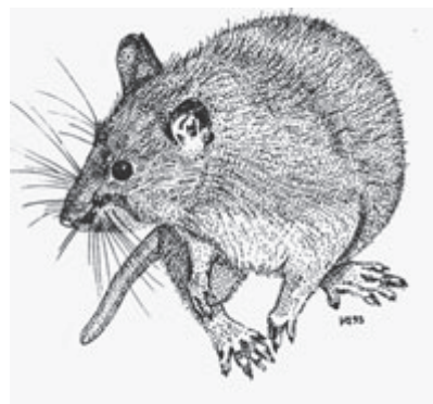
Tegning: Karl-Martin Vagn Jensen

Rotten er ret altædende, men foretrækker normalt kornprodukter. Den æder daglig en fødemængde, der svarer til ca. 1/10 af dens egen legemsvægt. I modsætning til mus, som klarer sig fint på helt tørre steder, skal rotten have adgang til drikkevand. Rotten klatrer og svømmer udmærket, men dens vigtigste redskaber er dog de store, mejselformede fortænder, som kan gnave i alt, der er mindre hårdt end jern - hvis bare tænderne kan få fat.